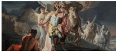
Exposición: Cuarenta años de amistad. Donaciones de la Fundación Amigos del Museo del Prado

Le invitamos a formar parte de este proyecto de mecenazgo Ventajas especiales por pertenecer a Ilustre Colegio Oficial de Médicos de Madrid: Titular 60€ anuales Familiars 35€ anuales