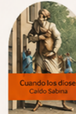
Cuando los dioses Caldó Sabina

9:30 h Salida en autobús gran turismo desde Atocha (El Enlince) con recogida en Móstoles, con parada intermedia para desayuno (no incluido)