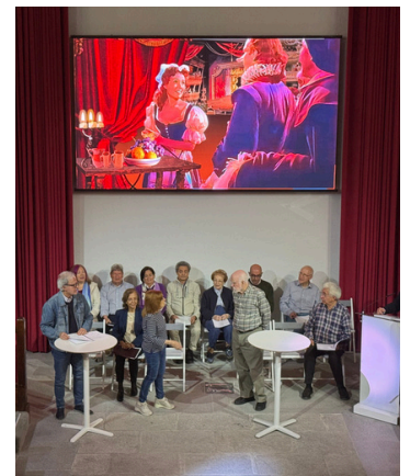
Ensayo previo del grupo de teatro

Lectura teatralizada: Representación a cargo del Taller de Poesía del Aula Lúdica del ICOMEM.