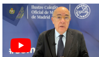
Boi Ruiz, ex consejero de Salud de la Generalidad de Cataluña